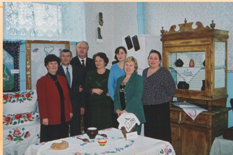
Встречи с интересными людьми